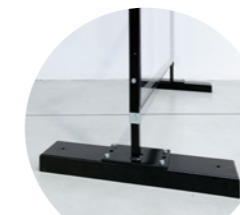
SOCKEL OHNE ROLLEN Für maximale Stabilität